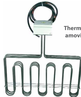
Thermoplongeurs amovibles plats

Nous pouvons réaliser des thermoplongeurs adaptés à votre installation. N'hésitez pas à nous consulter .