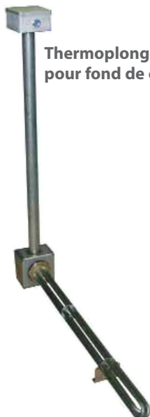
Thermoplongeurs amovibles pour fond de cuve

Chauffage de liquides dans des cuves ouvertes avec fixation sur le bord supérieur de la cuve ou équipées d'un "trou d'homme". Thermoplongeurs destinés au chauffage des liquides, souvent corrosifs, de certains bains de traitement de surface.