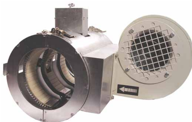
Tryskové těleso keramické s ventilátorem