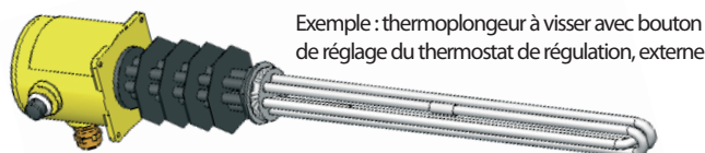
Exemple : thermoplongeur à visser avec bouton de réglage du thermostat de régulation, externe

Pour ces 2 cas, le bouton de réglage peut être disposé à l'intérieur ou à l'extérieur du boîtier, selon besoin.