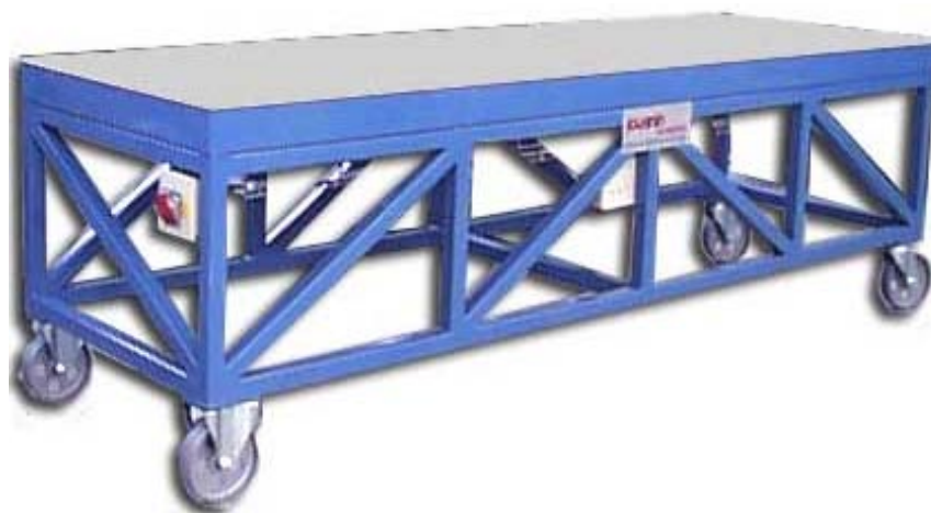
8 kW - Plateau acier 3000 x 900 mm Table montée sur roulettes - Coffret électrique indépendant