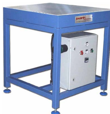
3 kW - Plateau aluminium 750 x 750 mm