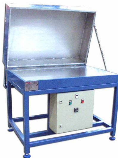
6 kW - Plateau aluminium 1200 x 800 mm Couvercle calorifugé