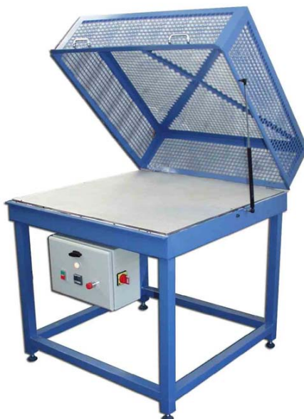
11 kW - Plateau acier 1000 x 1000 mm Table munie d'un capot de protection en tôle ajourée monté sur charnières, assisté par verin.