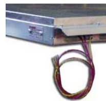
Détail de la disposition d'une des résistances