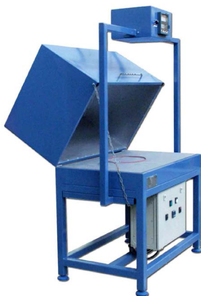
4 kW - Plateau acier 1000 x 600 mm Couvercle calorifugé et enregistreur de température