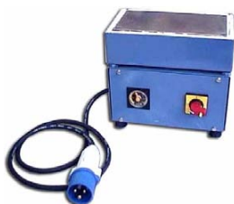
1.1 kW - Plateau inox 120 x 120 mm Avec coffret de régulation incorporé