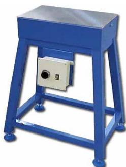
1.5 kW - Plateau 300 x 500 mm

NOUVEAU : Gamme standard Fiche technique des tables prédéfinies